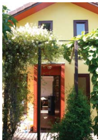
Différentes vues du chantier puis du projet achevé