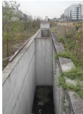
Etat initial d'une sortie de secours