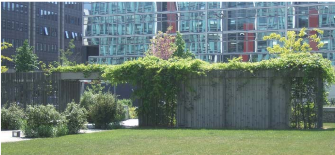
Édicule intégrant une VH de 4m 2 , ainsi qu'une sortie de secours de l'A14