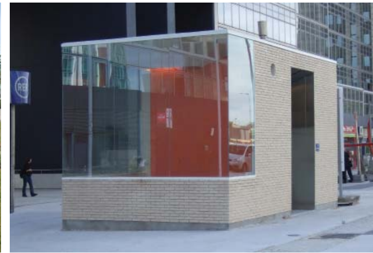
Édicule d'accès piétons, en briques, verre et inox, au cours du chantier