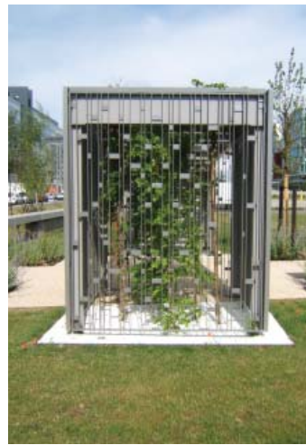
Profil avec espace planté protégé