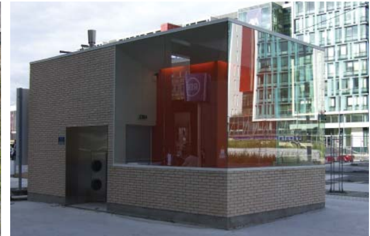
Une VH de 4m 2 est intégrée à l'édicule